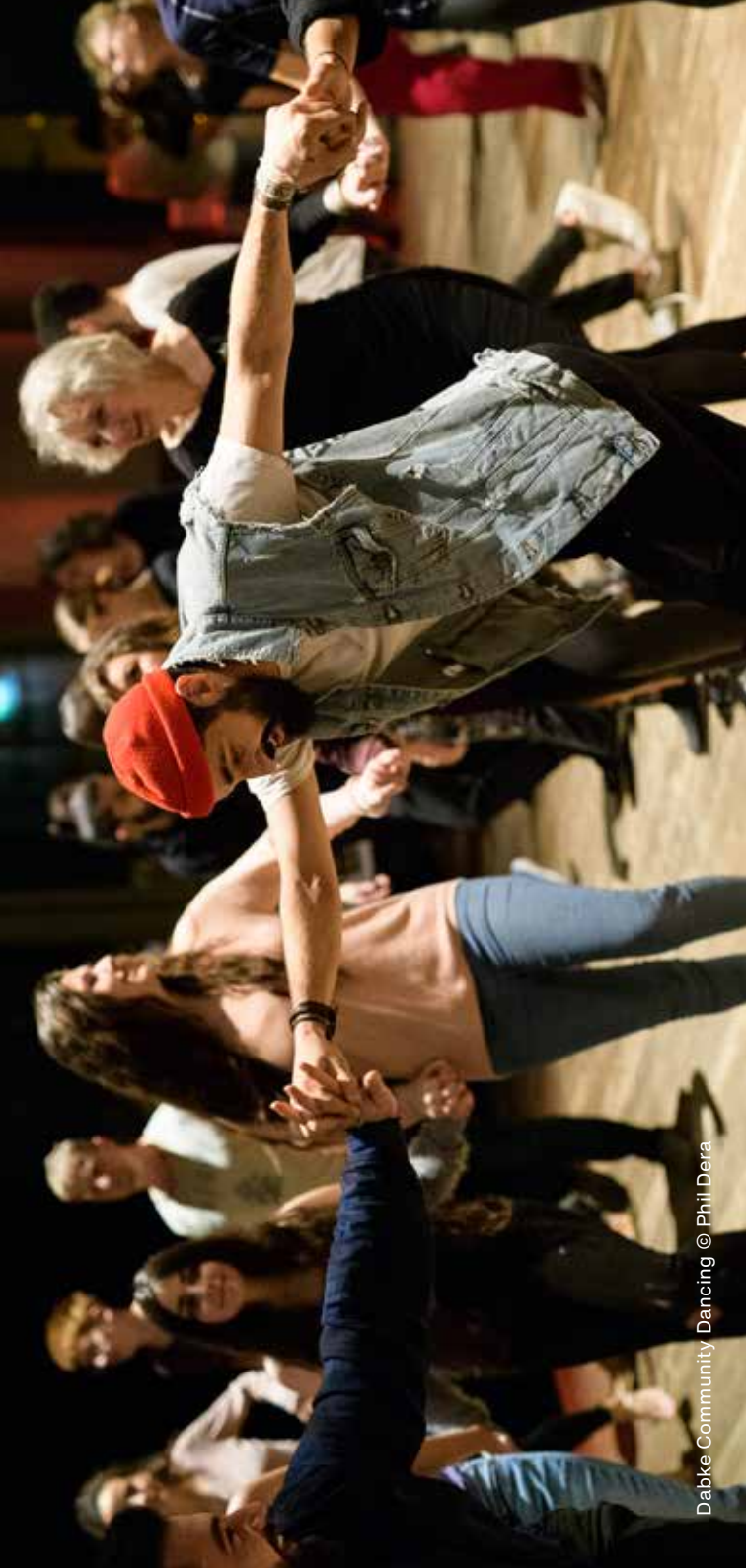
Dabke Community Dancing