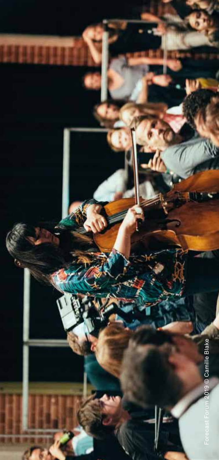
Forecast Forum 2019